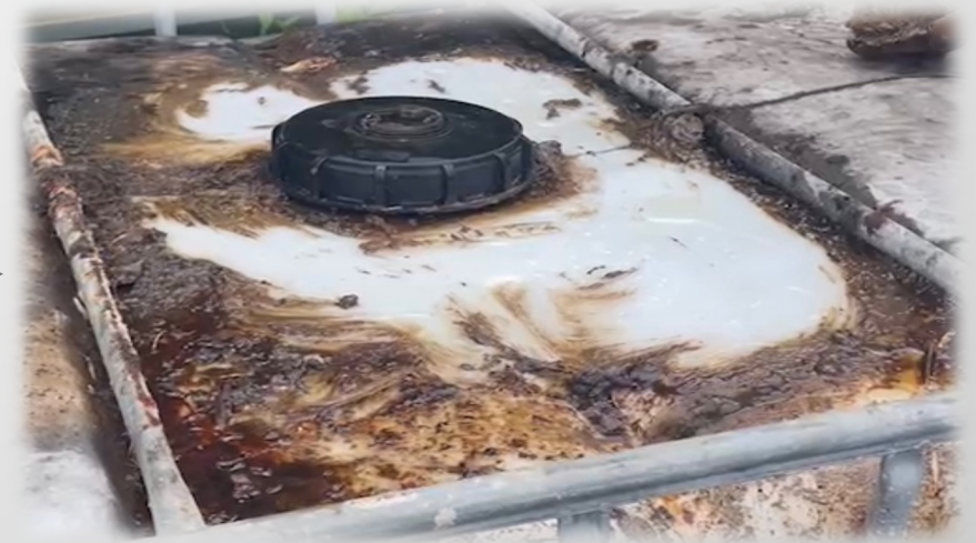
普通の水をかけてタワシで擦ったもの